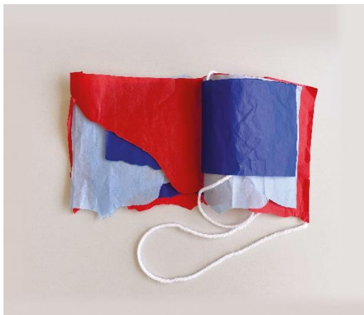
Fotografia Studio Dispari