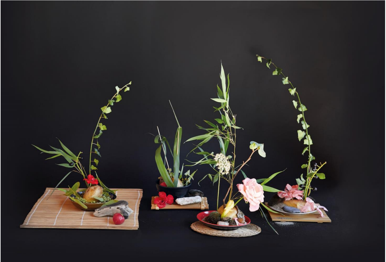
Alcuni Ikebana realizzati dai ragazzi nei laboratori